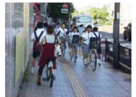
▲歩道いっぱいの自転車