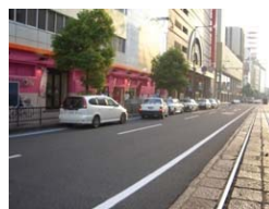
▲タクシーベイからはみ出した車両