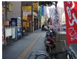
▲放置自転車や看板等の占拠